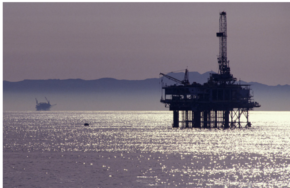
Pozo petrolero. ]

No cabe duda que la discusión de la reforma energética se centró en el régimen que debíamos adoptar en materia de exploración y producción de hidrocarburos, y en qué hacer con Pemex. Se olvida que el sector energético es mucho más amplio y que incluye subsectores de la mayor relevancia que deben ser conocidos y debatidos sin consideraciones ideológicas de por medio. Es notorio que el gobierno no está fomentando las condiciones necesarias para que se lleve a cabo una reforma energética incluyente, participativa y democrática que permita a la sociedad civil formar parte en la toma de decisiones de los problemas económicos, sociales, políticos y ambientales del país. Igualmente, es preocupante el hecho de que no haya coordinación entre la política energética y climática del país.