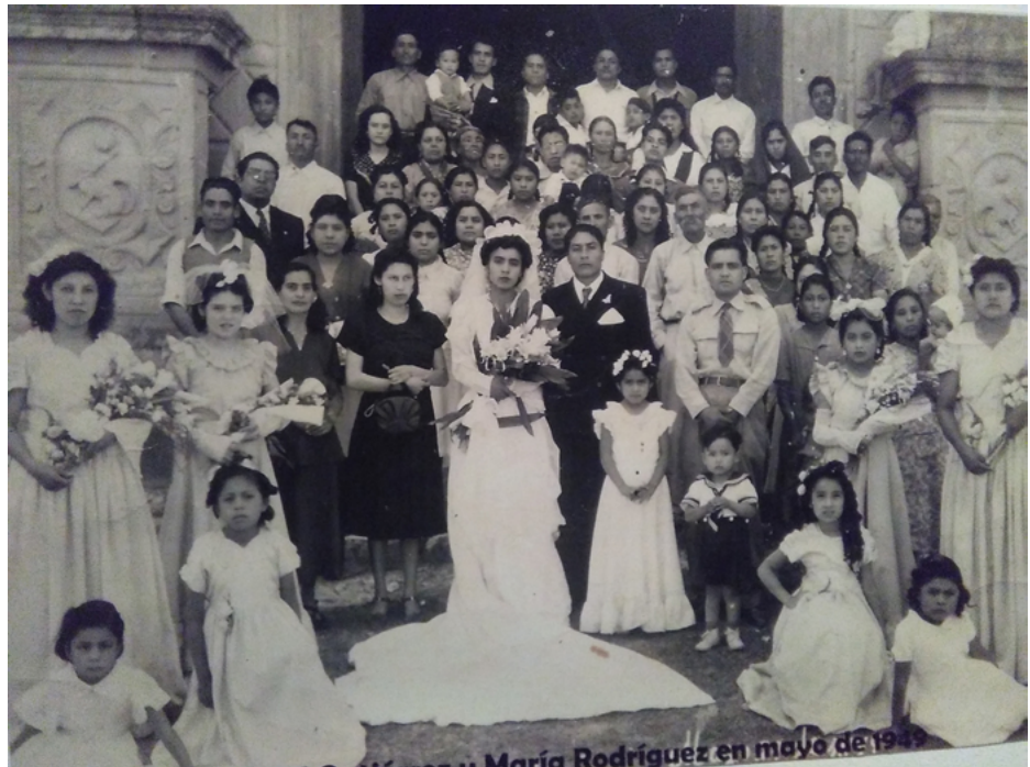
Fotografía 1. Boda en Santo Domingo Yanhuitlán, Oaxaca, 1949 (Exposición del museo comunitario de Yahuitlán, 2017).