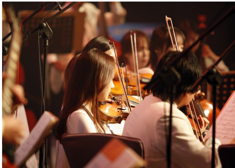
Imagen 1. Una persona o cien pueden escuchar un mismo concierto con el mismo resultado, esto es el principio de la no rivalidad.

Otra de las llamadas imperfecciones en el mercado asociadas a las artes que menciona Throsby (2001) es que el arte, o al menos cierto tipo, tiene características de un bien público. ¿Qué quiere decir esto? Que posee dos peculiaridades: la primera es la no rivalidad, que significa que alguien puede consumirlo sin afectar que otros lo consuman de igual manera. Una pintura o una pieza de música no se agota al verla o escucharla por muchas personas, respectivamente. La segunda es la no exclusividad, es decir, que no hay manera de prohibir que cualquier persona disfrute o se beneficie del arte (ver imagen 1).