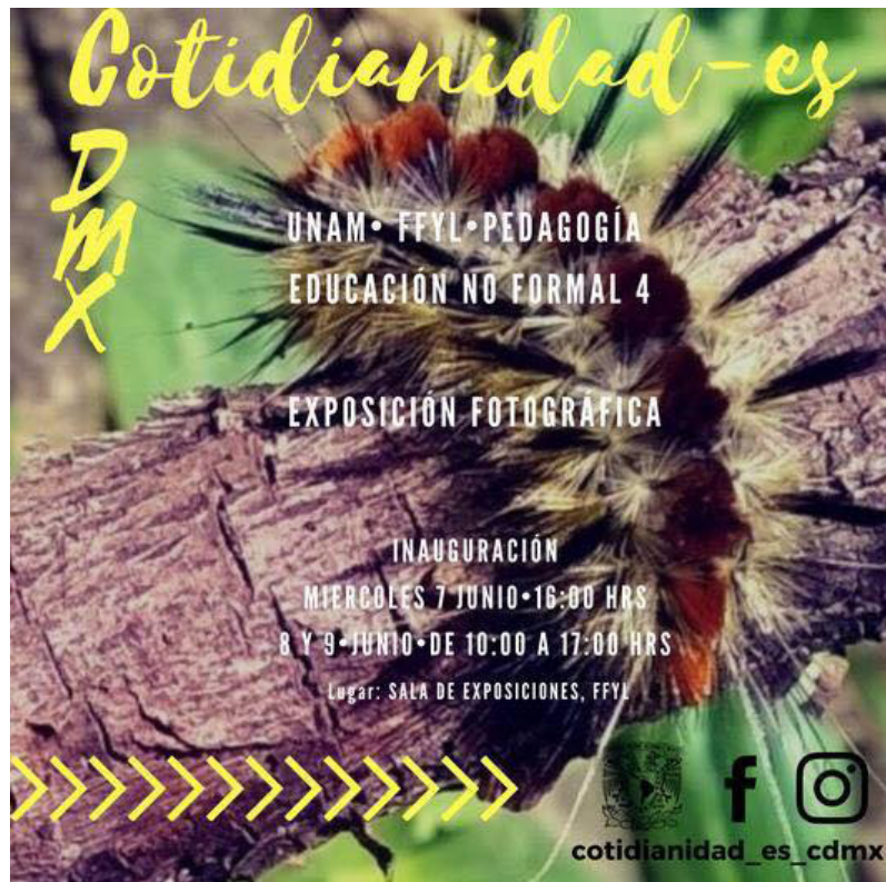
Fotografía 7. Ejemplo de invitación utilizada para la inauguración de Cotidianidad-es CDMX .