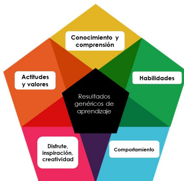
Figura 1. Resultados genéricos de aprendizaje ( generic learning outcomes ), de la campaña Inspiring Learning for All . 5

Los cuatro ejes descritos hasta este momento constituyen en gran medida el fundamento de mi práctica como docente para el diseño de experiencias educativas en el aula. A continuación, describiré brevemente algunas de las estrategias y actividades que he realizado utilizando la fotografía como recurso para explorar, reflexionar y proponer acciones de intervención pedagógica desde el aula.