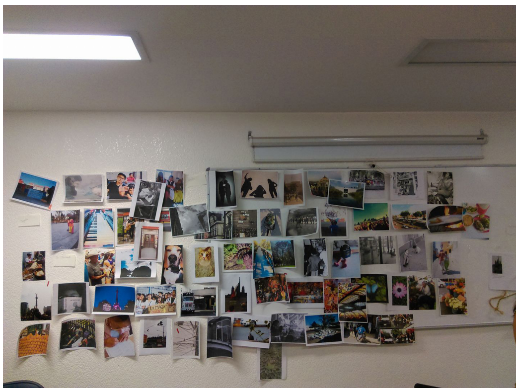
Fotografía 5. Proceso de selección de imágenes y creación de discurso visual. Salón 2-2 del Anexo de la Facultad de Filosofía y Letras, UNAM.

Cabe resaltar que en este tipo de proyectos se introducen actividades relacionadas con la curaduría para la creación del discurso expositivo: sobre qué se va a hablar y cómo se va a decir, desde dónde, desde qué referentes o posturas; la museografía , cómo exhibir las obras: el montaje propiamente, de acuerdo con el lugar de exhibición; y el diseño gráfico , para la elaboración de materiales de difusión como las invitaciones y la comunicación en redes sociales, además de la identidad gráfica de la propia exposición. En este sentido, la experiencia se vuelve valiosa porque los estudiantes pueden conocer procesos y retos de otras actividades y oficios para que, de manera interdisciplinaria, pueda lograrse un proyecto complejo como el de una exposición fotográfica.