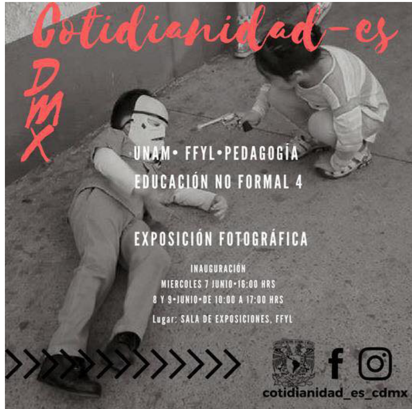
Fotografía 6. Ejemplo de invitación utilizada para la inauguración de Cotidianidad-es CDMX .