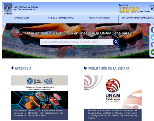
Vista de la página Toda la UNAM en línea.