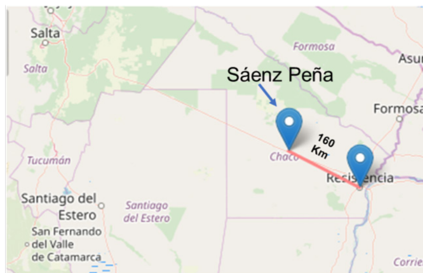
Figura 1. Distancia entre las ciudades de Presidencia Roque Sáenz Peña y Resistencia.

El inconveniente de la distancia entre el lactario de nuestra localidad y el BLM de la provincia ponen de manifiesto la necesidad y conveniencia de crear en nuestra región un BLM. En este sentido, nuestra universidad cuenta con la Unidad Médica Educativa (UME), la cual a partir de 2019 ha puesto en funcionamiento un lactario con miras a la implementación de un BLM propio, que servirá como unidad de apoyo clínico al Servicio de Neonatología que funciona en dicha unidad. La UME es un centro de salud ubicado en la planta baja de la Universidad, funciona como hospital-escuela y cuenta con salas comunes de internación, sala de terapia intermedia, unidad coronaria, servicio de neonatología y farmacia.