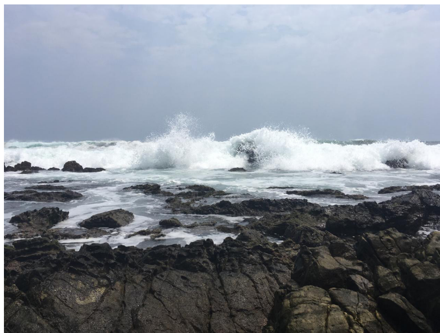
Figura 4. Fotografía que muestra el rompimiento de las olas en un intermareal rocoso.

Las costas rocosas intermareales sirven como interfaces cruciales entre los ecosistemas terrestres y marinos y por ello tienen gran relevancia ecológica (ver figura 4). El intermareal rocoso tiene un papel crucial como ecosistema costero; su importancia radica en la diversidad de especies que ahí habitan. Las zonas intermareales funcionan como hábitats clave para numerosas especies marinas y costeras, muchas de las cuales utilizan estas áreas para etapas importantes de su ciclo de vida, como el asentamiento, crecimiento o reproducción (Webb, 2007). Las costas rocosas intermareales son ecosistemas que han sido ampliamente estudiados debido a su fácil acceso y a que funcionan como verdaderos laboratorios naturales. En estas zonas, los organismos se distribuyen en franjas bien definidas a lo largo del gradiente de mareas, lo que permite observar con claridad cómo factores físicos, como la desecación o el oleaje, y factores biológicos, como la competencia o la depredación, influyen en la estructura de las comunidades. Además, muchos de los organismos viven fijos al sustrato y en áreas relativamente pequeñas, lo que facilita realizar experimentos manipulativos directamente en el campo y observar sus efectos a lo largo del tiempo (Hawkins et al., 2020).