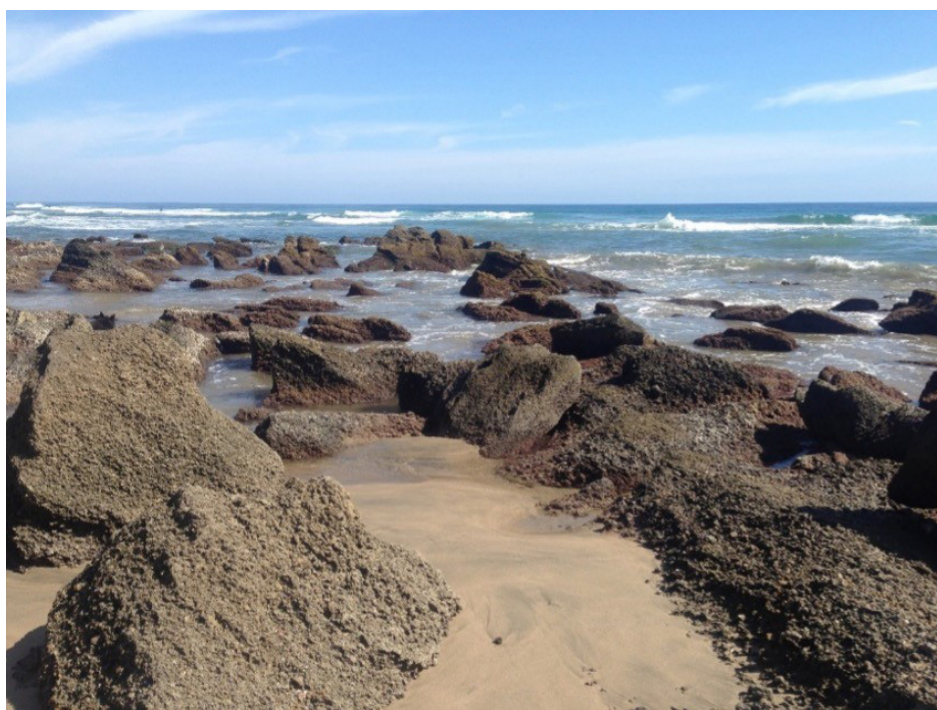
Figura 1. Fotografía de un intermareal rocoso que muestra la franja de desecación (supralitoral), las pozas de marea del mesolitoral y las áreas con influencia constante del oleaje (infralitoral).

Las zonas intermareales suelen describirse dividiéndolas en franjas con características distintivas, de acuerdo con los rangos de distribución de ciertos animales marinos o algas, así como con los límites y el nivel de influencia de las mareas. Los criterios clásicos de zonación establecen, por lo general, tres zonas: una zona superior o supralitoral expuesta frecuentemente al aire, una zona media o mesolitoral en donde se forman pozas de agua de mar con períodos cortos de exposición aérea y una zona inferior o infralitoral que se encuentra generalmente cubierta por el agua de mar (Stephenson y Stephenson, 1949; ver figura 1).